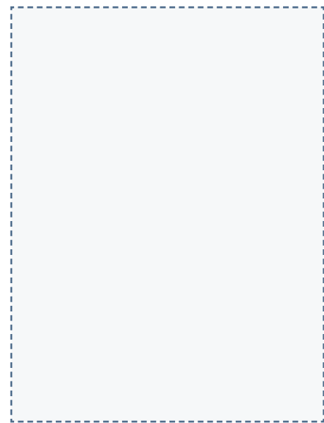
BOLSA DE HIELO

Colocar los materiales sobre esta alfombra le puede resultar útil. Así, es más sencillo seguir la guía paso a paso de su kit de inicio.