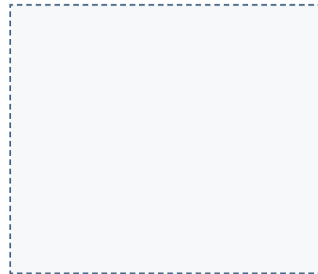
TOALLA IMPREGNADA EN ALCOHOL